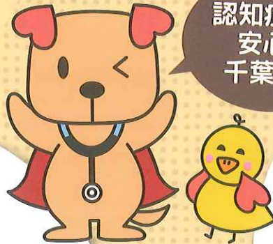
千葉県医師会 公式マスコットキャラクター ドク太とナービー

患者さん、そしてご家族を支える優しい「千葉」になるために、まずは認知症を知ってください。期間中、さまざまな企画をご用意していますので、ぜひお越しください。