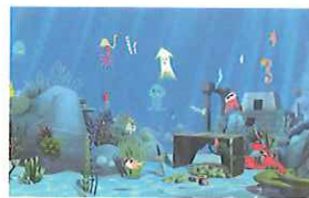
『紙アブリ』は株式会社リコーの商標でイベント向けソリューションです。