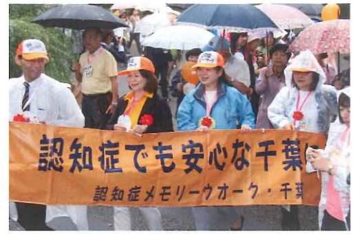
昨年のメモリーウオークの様子

歩くことは認知症の予防につながります。今年も青葉の森公園をクイズやゲームをしながら楽しく歩き、認知症についての理解を呼びかけます。